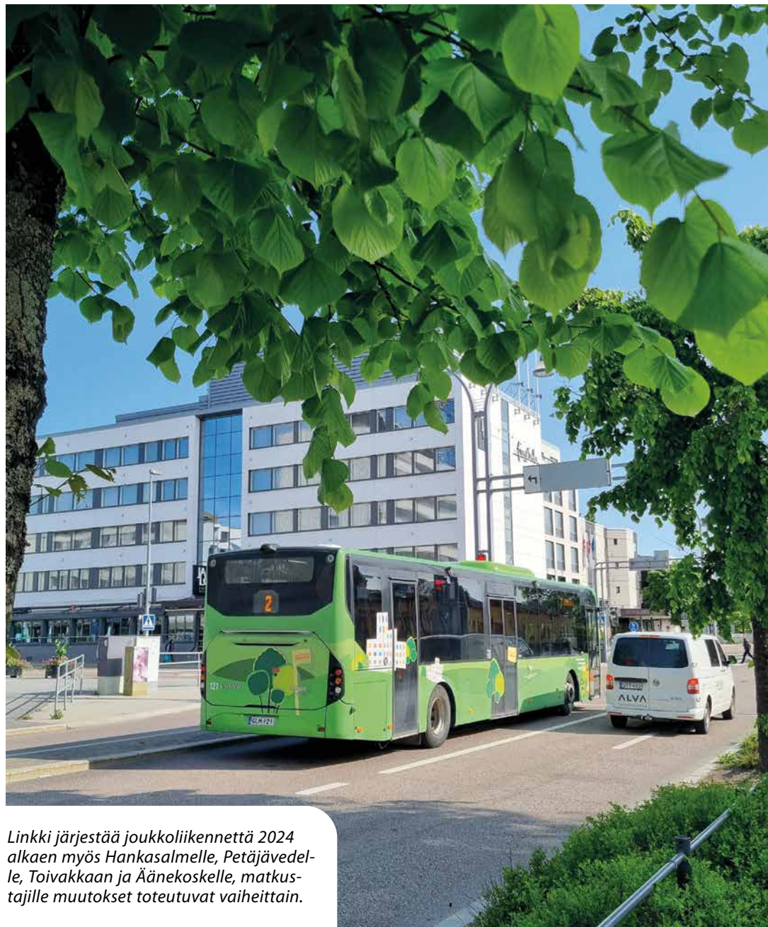
Linkki järjestää joukkoliikennettä 2024 alkaen myös Hankasalmelle, Petäjävedelle, Toivakkaan ja Äänekoskelle, matkustajille muutokset toteutuvat vaiheittain.