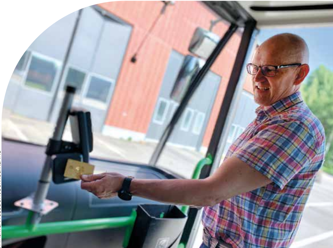
JYVÄSKYLÄN SEUDUN JOUKKOLIIKENNE

Lähimaksulla ostaessa kertalippu on samanhintainen kaikille. Erillisiä lasten, nuorten, opiskelijoiden tai senioreiden lippuja ei ole. Lippu on voimassa 90 min ostohetkestä.