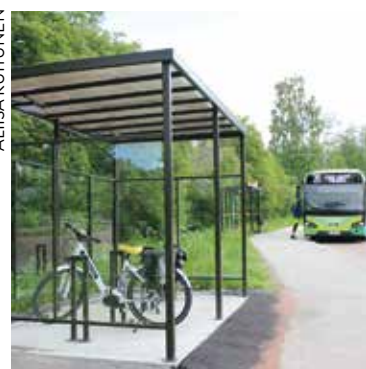
Pyöräliityntäpysäkit sijaitsevat linkkipysäkkien läheisyydessä.

– Pyöräliityntäpysäkit ovat pyöräparkkeja, joihin asukkaat voivat jättää polkupyörän esimerkiksi asiointireissun ajaksi. Jos matka kotoa linkkipysäkille on liian pitkä käveltäväksi, voi asukas ajaa sinne pyörällä, jättää pyörän liityntäpysäkille ja