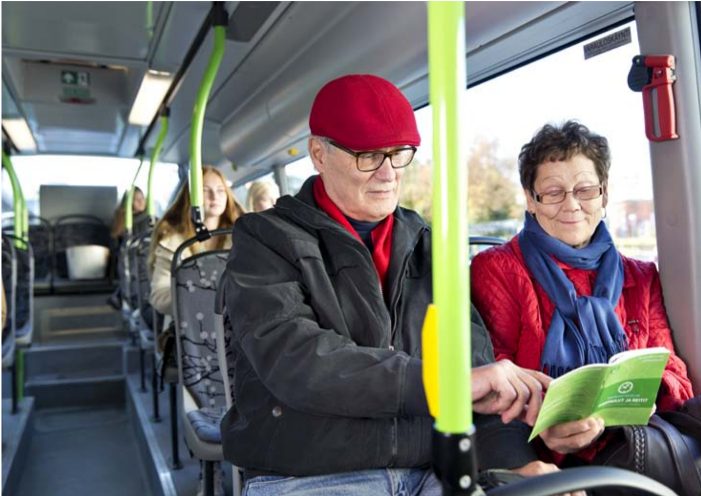
Linkkikummit voi pyytää opastusta ja neuvoja paikallisliikenteen palveluiden käyttämisessä.