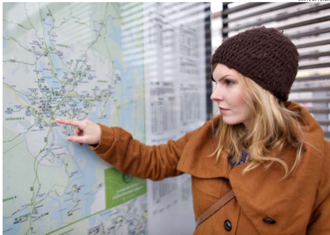
Paikallisliikenteen aikataulujen pitävyyttä ja reittien toimivuutta seurataan koko ajan. Isommat muutokset tehdään harkiten ja ne ovat mahdollisia aikataulukauden vaihtuessa.

Suosituimmalla Linkki-linjalla 25 on matkustajamäärien kasvun myötä ollut pitkään aikatauluongelmia. Haastetta on tuonut ruuhka-aikoina tukkeutuva Palokanorsi, ja nyt reitille avataan syksyllä myös uusi kauppakeskus Seppä. Aikataulujen toimivuuden parantamiseksi linjan autokiertoon lisättiin yksi auto. Nyt myös kaikki linjan 25 vuorot ajavat Kangaslammen kautta parantaen suunnan palvelutasoa. Linjat 1 ja 2 ajavat reittimuutoksen jälkeen Keskussairaalan-tietä Yliopistonkadun ja Rautpohjan sijaan. Muutos parantaa aikataulujen toimivuutta, mutta pidentää jonkin verran kävelymatkoja esim. Rautpohjan suuntaan.