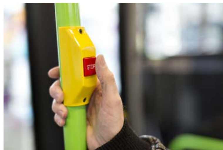
Paikallisliikenteen Linkki-palvelut sai seudun asukkailta arvosanan 4,8. Käytössä oli asteikko 1-6, jossa 1 oli huonoin ja 6 paras.

PAIKALLISLIIKENTEEN palveluista tehtiin alkuvuodesta asukaskysely, johon vastasi 1529 jyvaskyläläistä, laukaalaista ja muuramealaista. Vastajat olivat varsin tyytyväisiä Linkki-palveluihin: keskiarvoksi muodostui 4,81 asteikolla 1–6. Linkin palveluja ja imagoa kuvaavat vastaajien enemmistön mielestä laatusanat hyvämaineinen, luotettava, kehittyvä ja avoin.