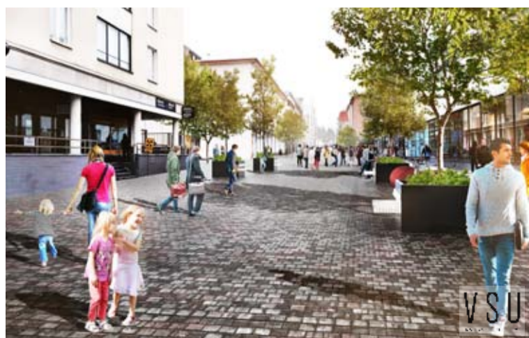
Suunnittelutoimiston havainnekuva siitä, miltä uudistetulla Väinönkadulla voisi jatkossa näyttää.