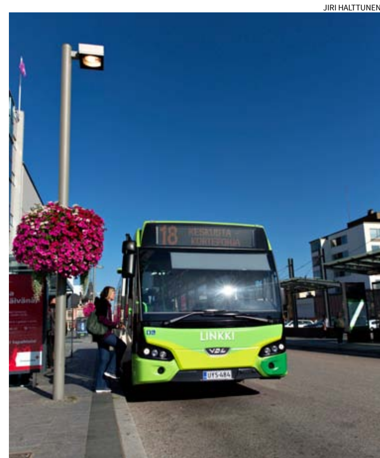
Muurame sijoittuu uudessa lippujärjestelmässä suurimmalta osaltaan B-vyöhykkeelle.